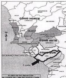
PLANO DE DELIMITACION DE CONOS DE LIMA METROPOLITANA

Con el distrito de Punta Hermosa a partir del último lugar, nombrado el límite describe una dirección general Suroeste siguiendo los linderos Norte y Noreste del Distrito de Punta Hermosa descritas en las leyes N° 12095 y N° 24513 siguiendo las divisorias de aguas en los Cerros Pacocha (Cota 636), Peña Higuera (Cota 1,539), Chancamita (Cota 1,000), San José (Cota 725), Pactá (cota 625) y Carpino (Cota