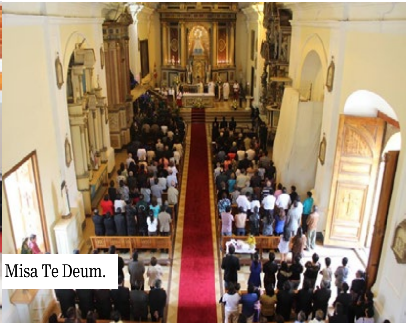
Misa Te Deum.