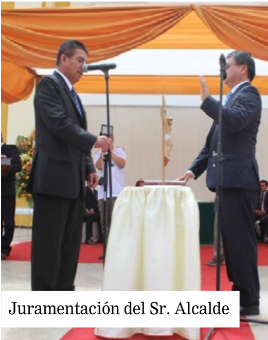
Juramentación del Sr. Alcalde