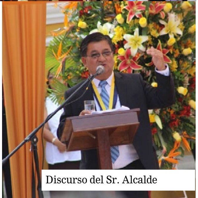
Discurso del Sr. Alcalde