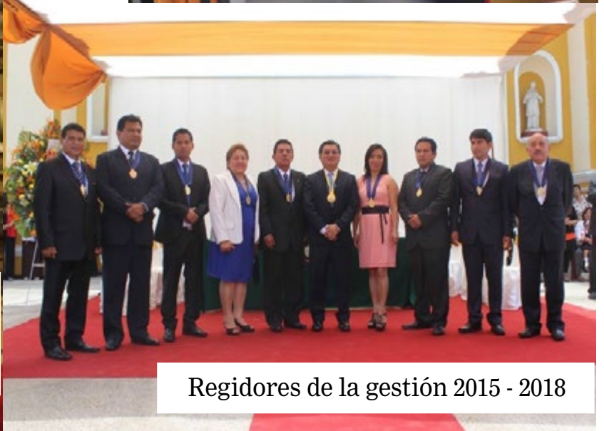
Regidores de la gestión 2015 - 2018