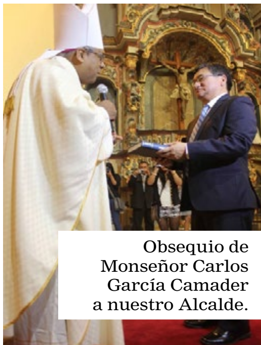
Obsequio de Monseñor Carlos García Camader a nuestro Alcalde.